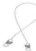
Cable de Acero Galvanizado.