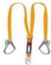
Estrobo con Doble Cabo de Vida.