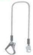
Cuerda de Nylon Trenzado.