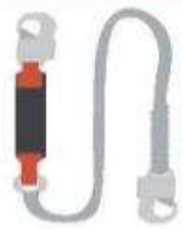
Estrobo con Amortiguador.