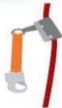
Estrobo Corto (Riel o Cuerda Vertical).