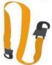
Correa de Fibra Sintética Simple.