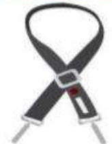
Correa Sintética de Largo Ajustable.